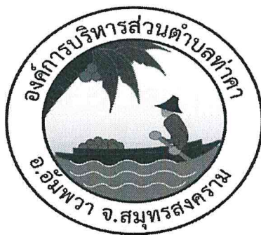
ตัวอย่าง

ผู้ขายจะต้องพ่นตราสัญลักษณ์ องค์การบริหารส่วนตำบลท่าคา ขนาดกว้าง ยาวไม่น้อยกว่า ๑๘ เซนติเมตร และอักษรชื่อเต็ม “องค์การบริหารส่วนตำบลท่าคา” ขนาดสูงไม่น้อยกว่า ๕ เซนติเมตร หรือชื่อย่อขนาดสูงไม่น้อยกว่า ๗.๕ เซนติเมตร พร้อมเลขครุภัณฑ์หมายเลข โดยให้พ่นสีขาวเว้นแต่ใช้สีขาวแล้วเห็นไม่ชัดเจนให้ใช้สีอื่นแทน ไว้ด้านข้างรถทั้งสองด้าน