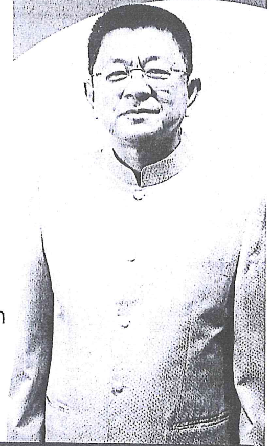
นายชอร ศรีวโนทัย อธิบดีกรมส่งเสริมการปกครองท้องถิ่น

5. สนับสนุนให้อาสาสมัครท้องถิ่นรักษ์โลก ร่วมกันทรนรงค์ใช้กระทง 1 ครอบคร้ว ต่อ 1 กระทง เลือกใช้วัสดุที่ทำจาก ธรรมชาติ ร่วมกันคัดแยกขยะ และรักษาความสะอาด